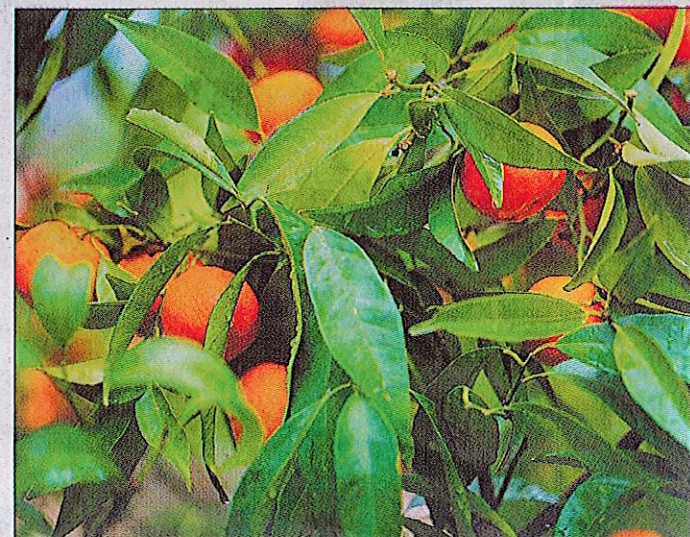
Le but du projet est de valoriser la filière agrumicole.