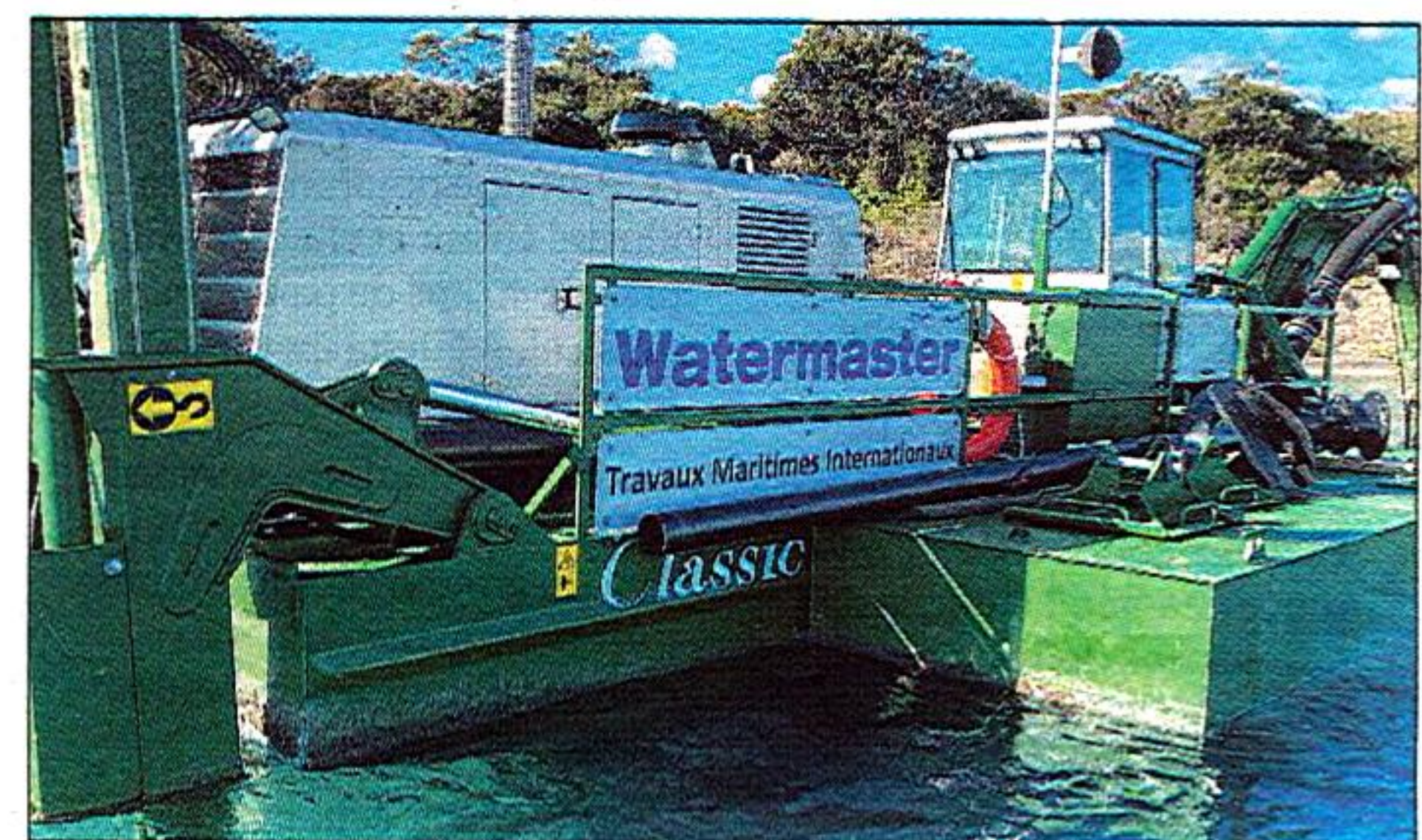
TMI s'équipe d'un matériel qui lui ouvre de nouveaux horizons en matière prospective de marchés publics.