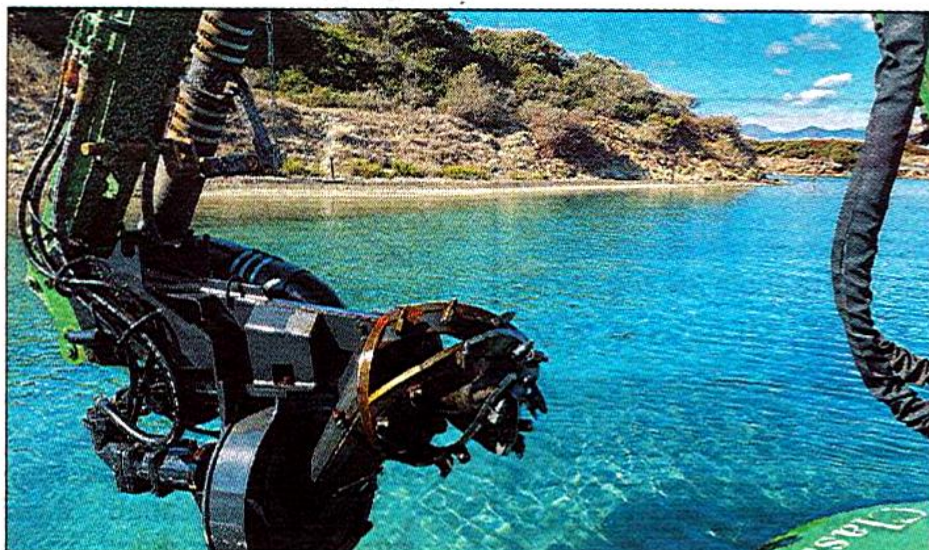
Au bout du bras articulé, la « cutter pump » assure un dragage et un pompage du sable et autres sédiments efficaces.

Plusieurs forets accouplés à une pompe aspirante capable de rejeter 960 m 3 de sable à l'heure équipent le bras hydraulique principal. Le sable est projetable à terre jusqu'à 1 400 mètres de distance du lieu de pompage. Le bras peut être également équipé de godets, d'outils de battage et d'un grand râteau. Dans la cabine entièrement climatisée, un logiciel, le Novatron X site assiste l'opérateur, en lui indiquant les profondeurs de dragage à respecter et les corrections à apporter en fonction